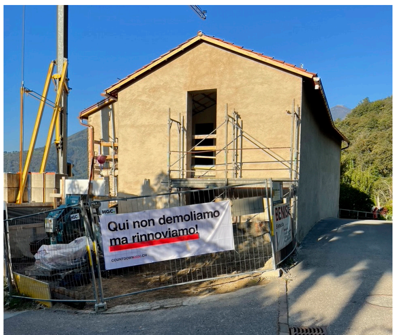
Umbau im Tessin, © Valsangiacomo Boschetti Architetti

Wer ein solches Bauplakat ausleihen möchte, darf sich per E-Mail an bauplakat@countdown2030.ch wenden.