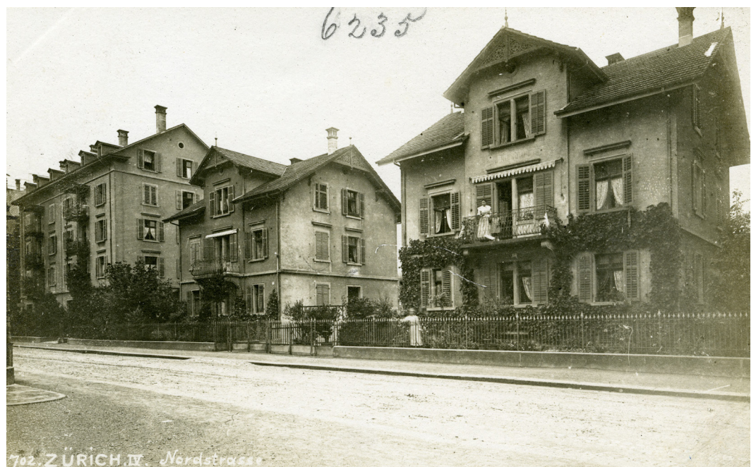
Nordstrasse, F. Ruef-Hirt, Baugeschichtliches Archiv Zürich